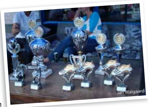
Prijzen seizoen 2011/2012

Van de 16 teams verdeeld over poule-A en poule-B stopt alleen ASKU dat degradeerde uit poule-A. Dit betekent dat nieuwkomer 100%voetbal in poule-B komt te spelen. PROXSYS* 2 is na het kampioenschap én de bekerwinst weer waar zij behoren te spelen, namelijk in poule-A. Voor het eerst zal het aankomende seizoen worden geopend met een Supercup wedstrijd. De kampioen uit poule-A, Gozaal/ComputeQ 3 zal het hierin opnemen tegen bekerwinnaar PROXSYS* 2. Gelijk een spektakel aan het begin van het seizoen dus! Aangezien er dit jaar maar liefst zeven teams zich hebben aangemeld op de wachtlijst gaat het bestuur komend seizoen de mogelijkheid bekijken om te groeien. We houden jullie hierover op de hoogte.